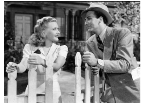
1938 RÊVES DE JEUNESSE (Four Daughters) de Michael Curtiz avec Priscilla Lane