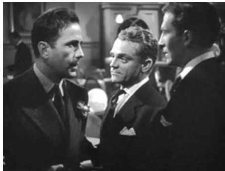
1939 LES FANTASTIQUES ANNÉES 20 (The Roaring Twenties) de R. Walsh avec H. Bogart, J. Cagney