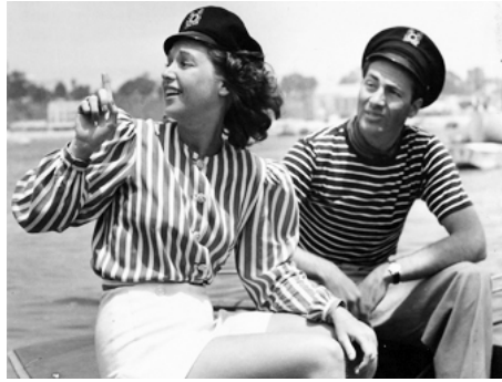
1939 QUATRE JEUNES FEMMES (Four Wives) de Michael Curtiz avec Rosemary Lane