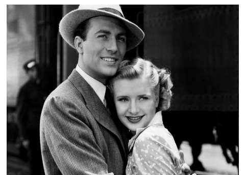
1941 FEMMES ADORABLES (Four Mothers) de William Keighley avec Priscilla Lane