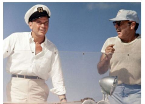
1967 TONY ROME EST DANGEREUX (Tony Rome) de Gordon Douglas avec Frank Sinatra