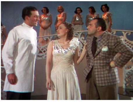
1938 OUT WHERE THE STARS BEGIN de Bobby Connolly avec Armida, Fritz Feld