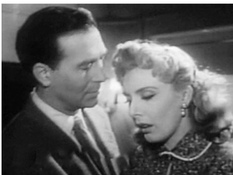
1954 DOORWAY TO SUSPICION de Dallas Bower avec Linda Carroll