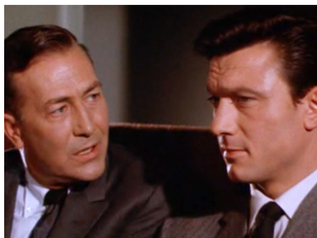
1960 LA VÉNUM AU VISON (Butterfield 8) de Daniel Mann avec Laurence Harvey