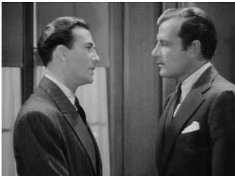
1939 AGENT DOUBLE (Espionage Agent) de Lloyd Bacon avec Joel McCrea