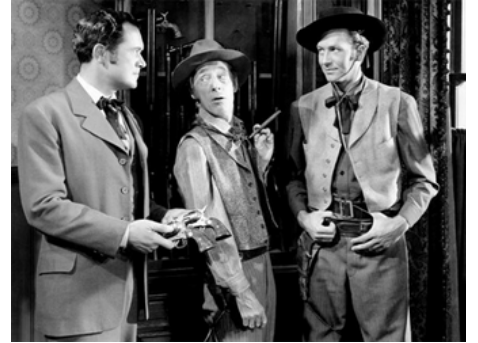
1948 BANDITS DE GRANDS CHEMINS (Black Bart) de G. Sherman avec Frank Lovejoy, Percy Killbride