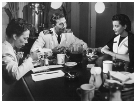
1950 DANS LES MERS DE CHINE (Captain China) de Lewis R. Foster avec Ellen Corby, Gail Russell