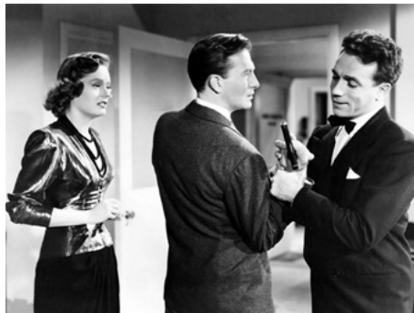
1948 WHIPLASH de Lewis Seiler avec Alexis Smith, Dane Clark