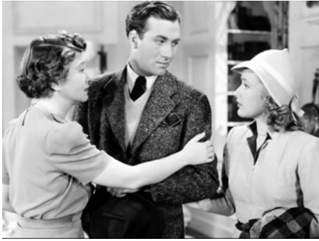
1939 LE PRINTEMPS DE LA VIE (Yes, my Darling Daughter) de W. Keighley avec Fay Bainter, P. Lane