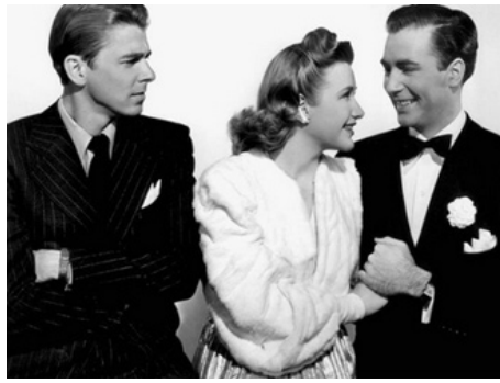
1941 MILLION DOLLAR BABY de Curtis Bernhardt avec Ronald Reagan, Priscilla Lane