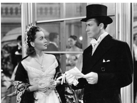
1940 MY LOVE CAME BACK de Curtis Bernhardt avec Olivia de Havilland