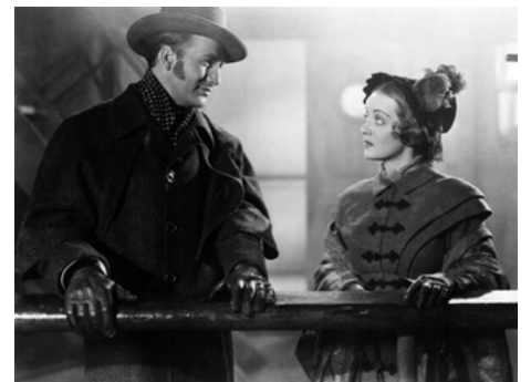
1940 L'ÉTRANGÈRE (All This, and Heaven Too) d'Anatole Litvak avec Bette Davis