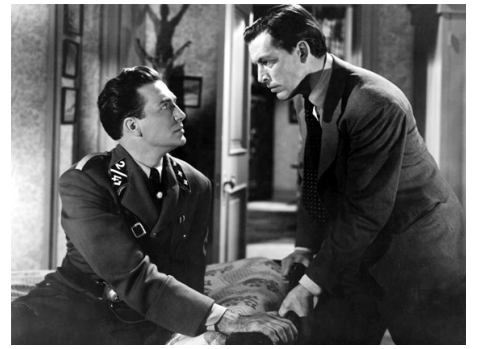
1941 UNDERGROUND de Vincent Sherman avec Philip Dorn