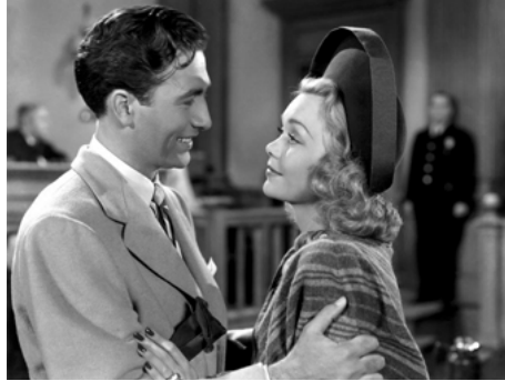
1941 THE BODY DISAPPEARS de D. Ross Lederman avec Jane Wyman