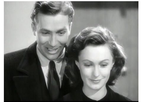
1939 UN ENFANT EST NÉ (A Child is Born) de Lloyd Bacon avec Geraldine Fitzgerald