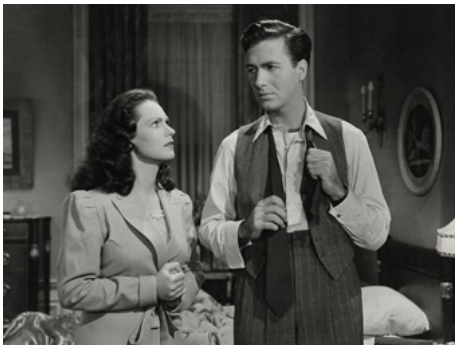
1941 FLIGHT FROM DESTINY de Vincent Sherman avec Geraldine Fitzgerald