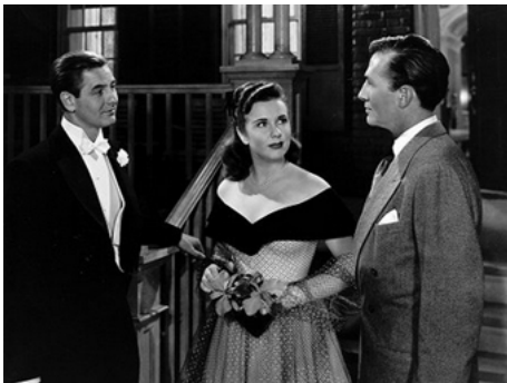
1948 LA PETITE TÉLÉPHONISTE (For the Love of Mary) de F. De Cordova avec Don Taylor, D. Durbin