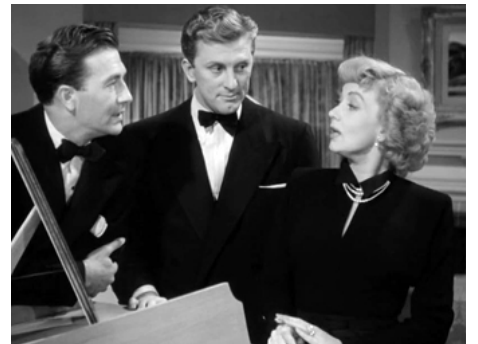
1949 CHAÎNES CONJUGALES (A Letter to three Wives) de J. Mankiewicz avec Kirk Douglas, Ann Sothorn