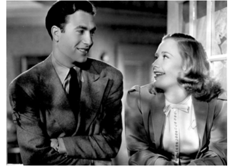
1939 FILLES COURAGEUSES (Daughters Courageous) de Michael Curtiz avec Priscilla Lane