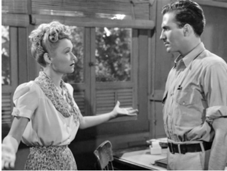
1941 LA LOI DES TROPIQUES (Law of the Topics) de Ray Enright avec Constance Bennett